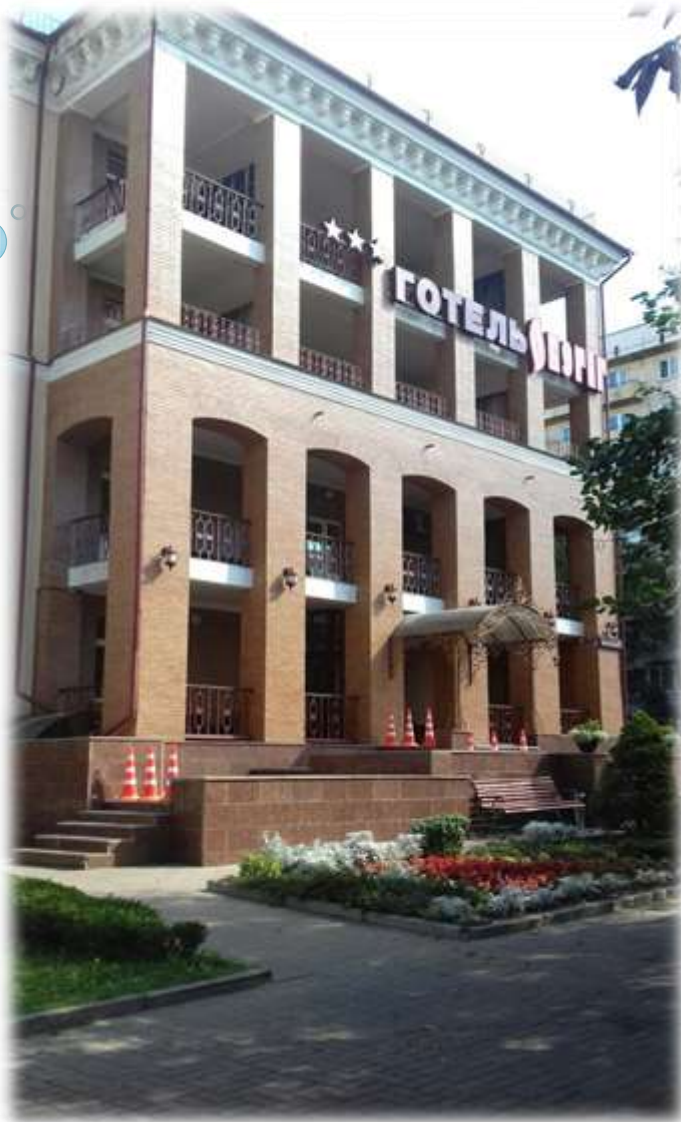
Готель «Оберіг» - оберігає від лих.

Студенти 1 курсу ГРСд в рамках практики «Вступ до фаху» відвідали: готель «Оберіг», який входить до списку кращих готелів Києва, один з найбільш відомих ресторанів м. Києва «Ю.К.» та Бутик-отель «Баккара», який знаходиться прямо на березі річки Дніпро, недалеко від історичного центру Києва, стадіона «Динамо» та станції метро «Гідропарк».